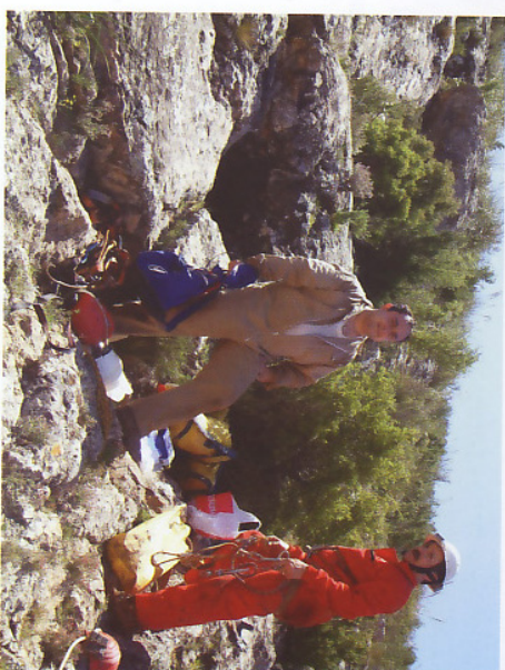
Boca de entrada

La entrada de la cavidad es muy pequeña y sólo la veremos cuando estemos muy cerca. Es la cueva más clásica y conocida de todos los que practicamos espeleología en Jumilla. Es la cueva escuela, donde llevamos a todos los iniciados a este deporte.