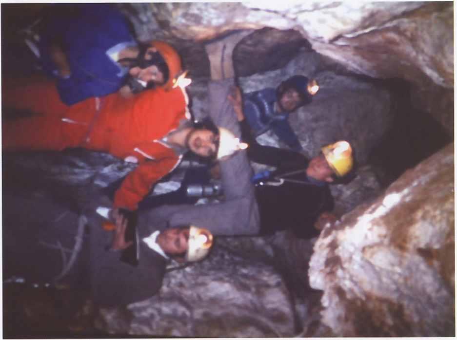
Topografiando la cavidad