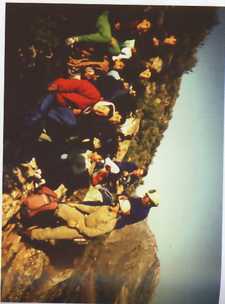
Entrada a la cueva

Llegaremos hasta la boca de la cueva (un pequeño agujero en el suelo), antes de llegar la cima.