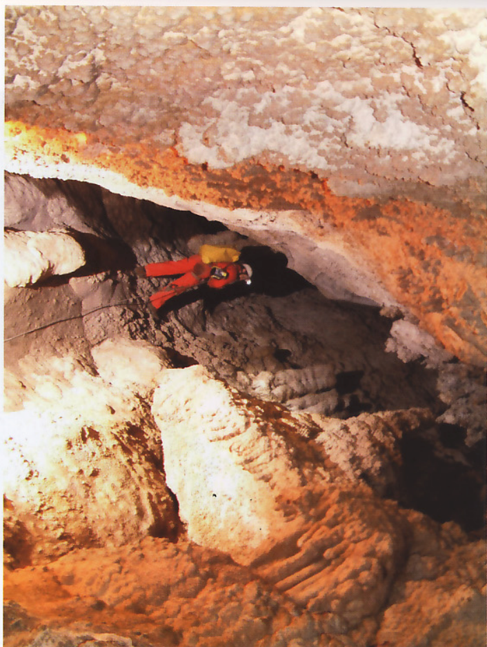
Cueva del Portichuelo, bajando el pozo